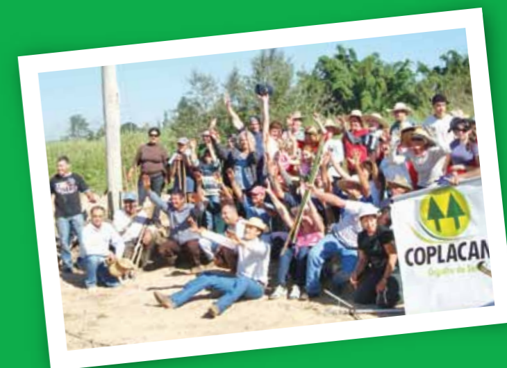
1 Supervisor Agrícola e 2 Consultor ambiental

Esse evento contou com a participação de 70 pessoas incluindo crianças que estão sendo incluídas em projetos desse nível para que elas sejam os multiplicadores na preservação do meio ambiente.